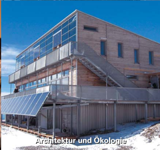
Architektur und Ökologie