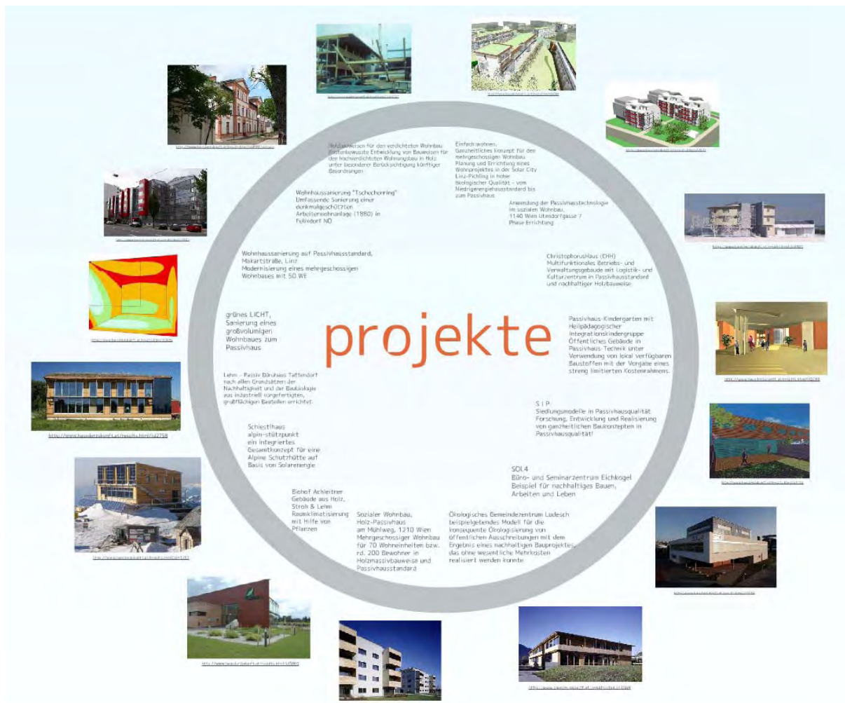
Abbildung 3: Screenshot HAUS der Zukunft Zielgruppeninfo, Zoom Projektübersicht