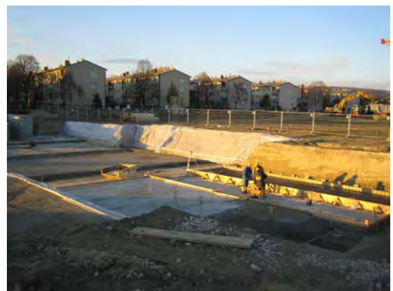
17.11.2005: Betonieren der Bodenplatte Haus C