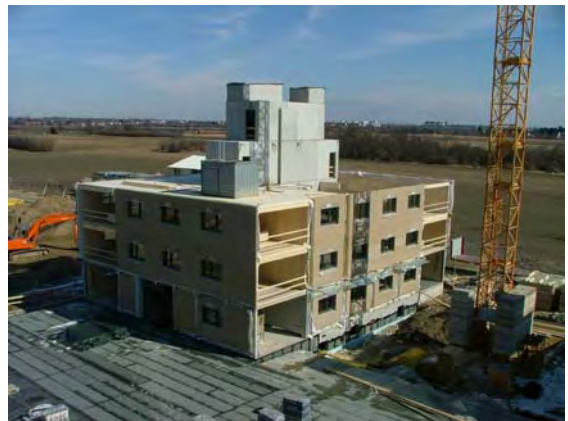
02.03.2006: Haus C