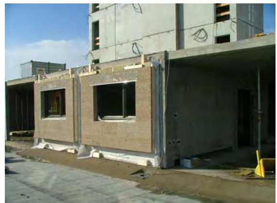
09.02.2006: Haus A – Montage der ersten Fertigteile im EG