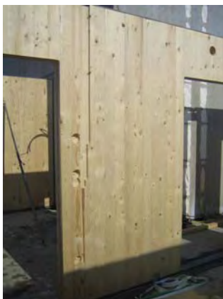
14.02.2006: Fräsungen für die Elektroverkabelung