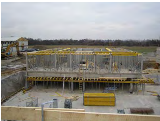
14.12.2005: Schalungsarbeiten Decke über EG Haus C