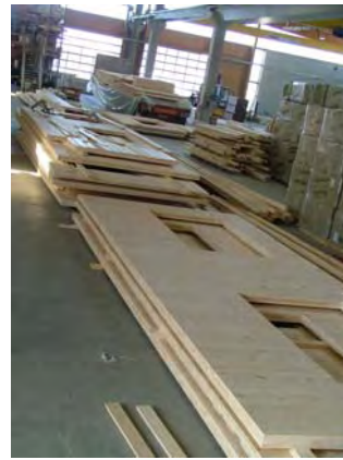
01.02.2006: KLH-Platten vorbereitet zur Fertigung