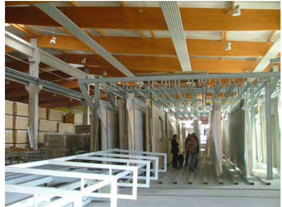
01.02.2006: Fertigteile bereit zur Montage