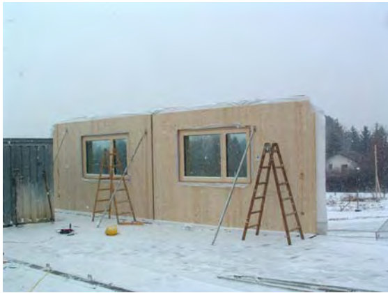
13.02.2006: Montage der Regelgeschosse (auch bei Schneefall)