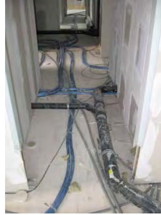
26.04.2006: Bodeninstallation Dachgeschoss