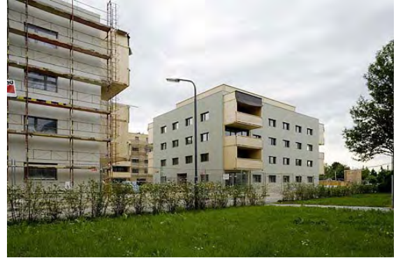
06.2006: Baustelle