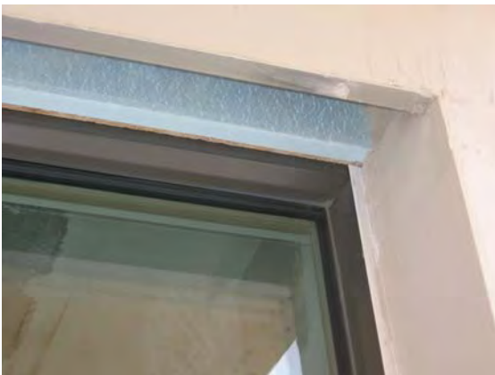
26.04.2006: Detail Fenstersturz vor Einbau der Jalousiekästen