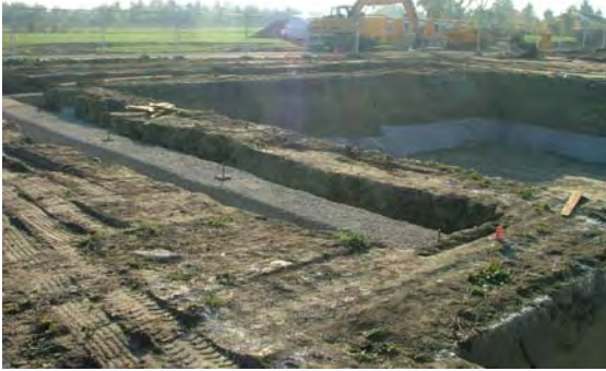
08.11.2005: Pfahlrost Haus D