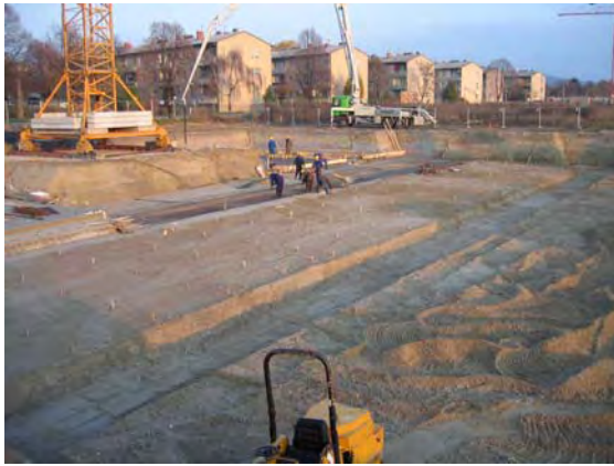
11.11.2005: Baugrube Tiefgarage, Herstellen des Niveaus, Sauberkeitsschicht, bewehren der Streifenfundamente für die Säulen der Tiefgarage