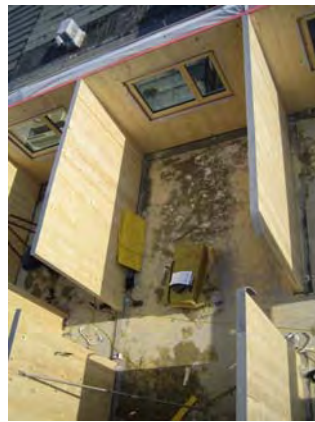
14.02.2006: Wände bereit zur Montage der Decke Fugenbänder