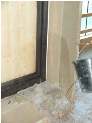
01.02.2006: Musterfertigteile: Prüfung „Schlagregendichtheit“