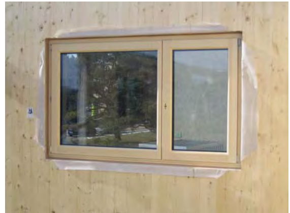
14.02.2006: Strömungsdichter Fenstereinbau werkseitig links mittig sieht man das Prüfsiegel für das Fertigteil