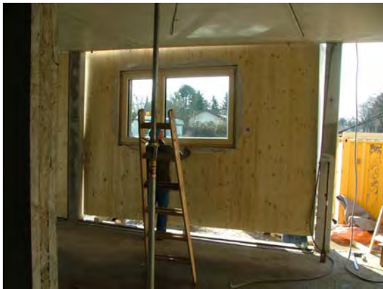
09.02.2006: Heben in die Montageposition