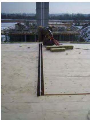
15.02.2006: Nachbearbeitung am Detail Wohnungstrennwand - Decke