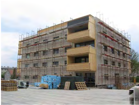
26.04.2006: Haus A eingerüstet, Verputzarbeiten