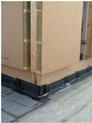
24.02.2006: Detail Aussenecke am DG nach Montage mit Montageabdichtung