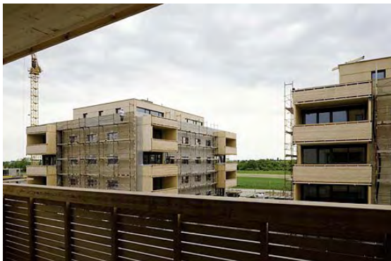
06.2006: Baustelle