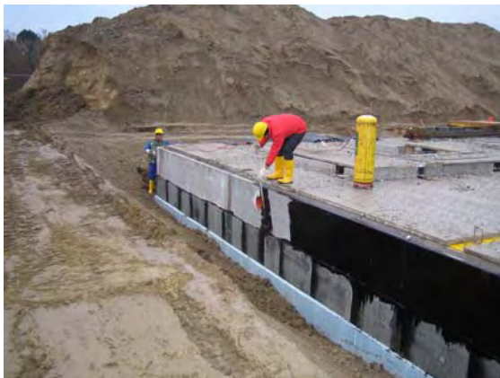
07.12.2005: Voranstrich, Hochziehen der Dichtung Haus D