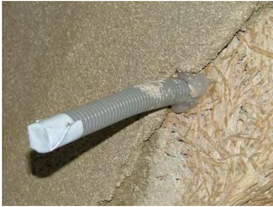
01.02.2006: Musterfertigteile: luftdichte Elektrodurchführung