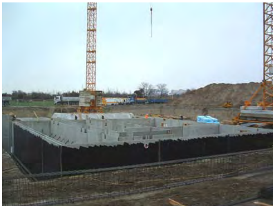
21.11.2005: Kellerwände Haus B, Bewehrung der Pfahlrostschürze