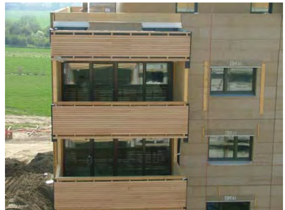
20.04.2006: Haus D - Loggien