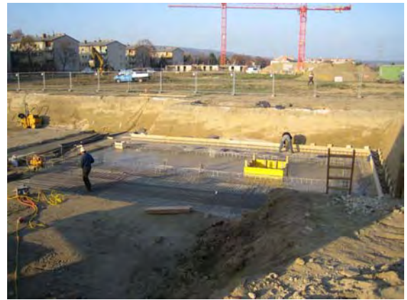
15.11.2005: Betonieren der Bodenplatte Haus C