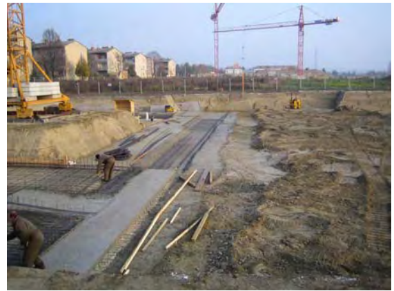
09.11.2005: Baugrube Haus A und B sowie Tiefgarage, Sauberkeitsschicht, bewehren und betonieren der Bodenplatte