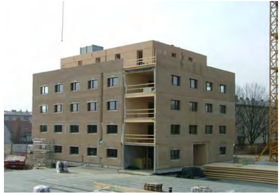
24.02.2006: Haus A – Montage der Fertigteile fertig (ausgenommen Loggien)