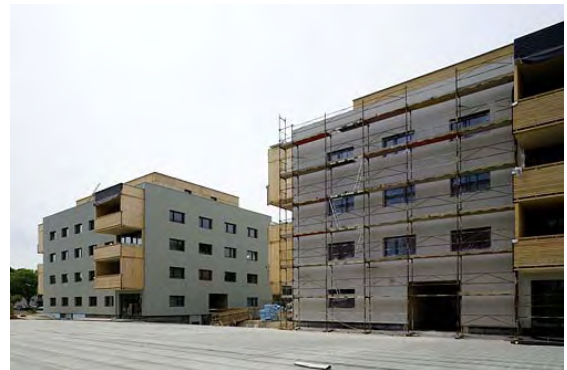
06.2006: Baustelle