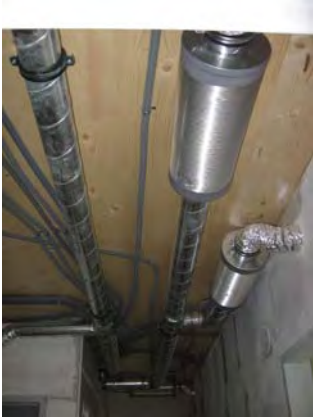
26.04.2006: Deckeninstallation, Schalldämpfer