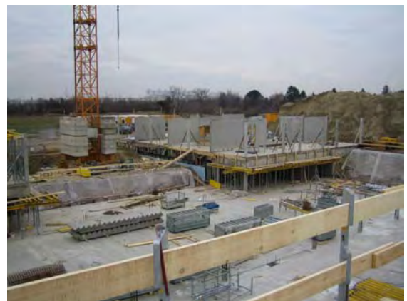
14.12.2005: Wände und Säulen EG Haus D