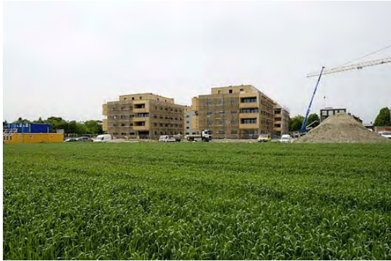
06.2006: Baustelle