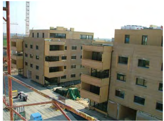
20.04.2006: Haus C,D, Montage Fertigteile abgeschlossen