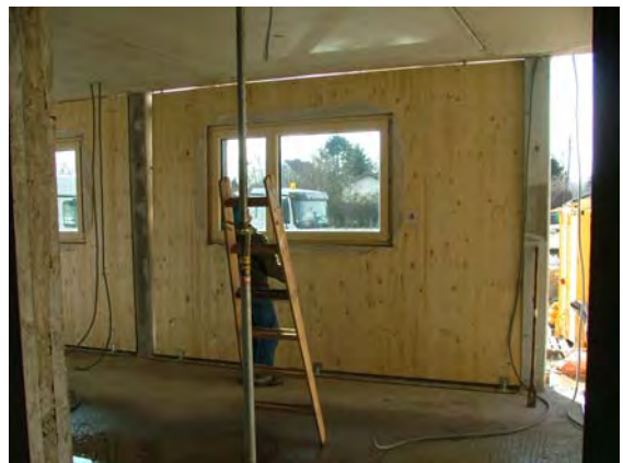
09.02.2006: Eindrücken in die Kopfposition