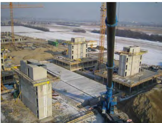
24.01.2006: Treppenhäuser mit gedeckter Tiefgarage