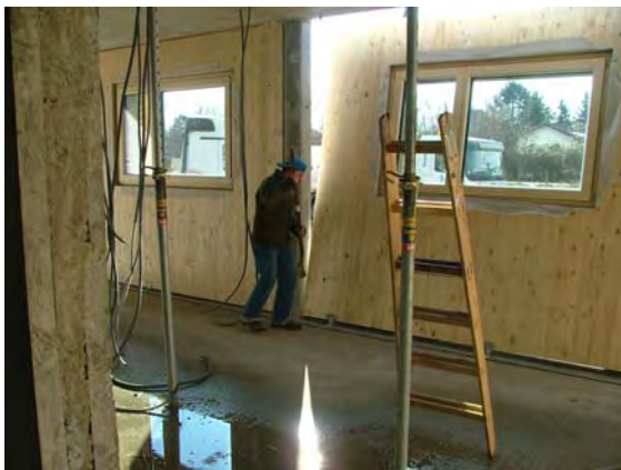
09.02.2006: Einrücken in die Fußposition