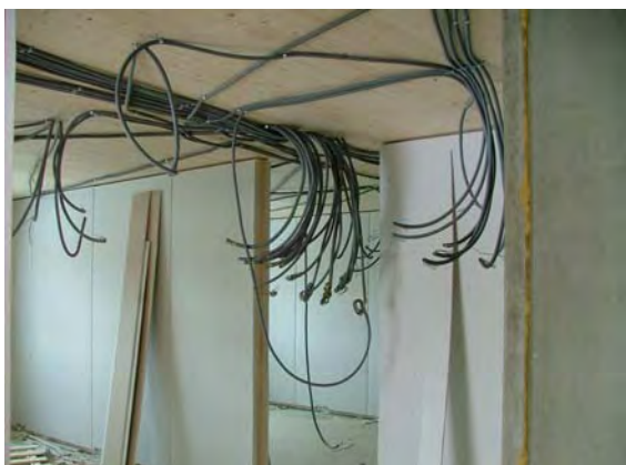
09.03.2006: Haus A - Elektromontage