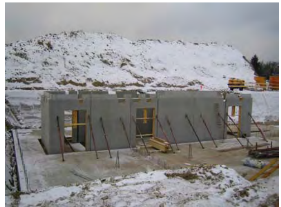
21.11.2005: Erster Schnee. Treppenhaus UG Haus D