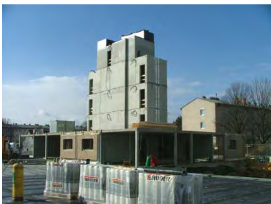
09.02.2006: Haus A – Montage der ersten Fertigteile