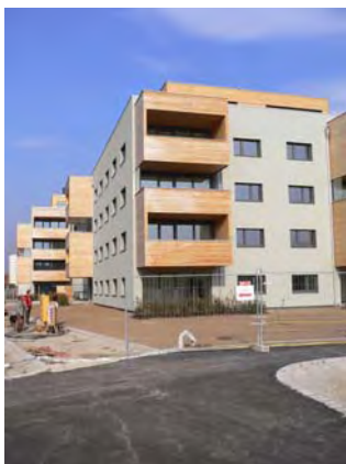
22.10.2006: Haus A – Blick in den Mühlweg