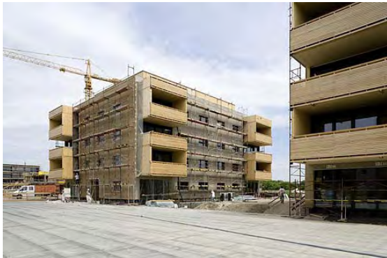
06.2006: Baustelle