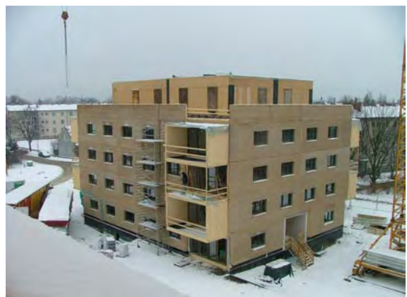
09.03.2006: Haus A inkl. Loggien