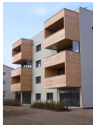
22.10.2006: Haus A – Terrassen im EG, Loggien in den OG