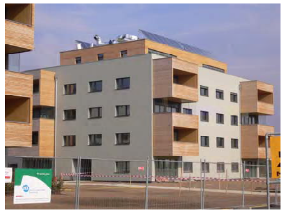
22.10.2006: Haus D – am Dach Sonnenkollektoren u. TGA