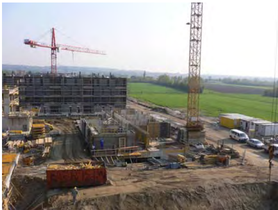
05.05.2006: Bauplatz B – Blick ins Marchfeld