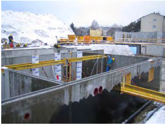
30.11.2005: Schalungsarbeiten Decke über UG, Haus D