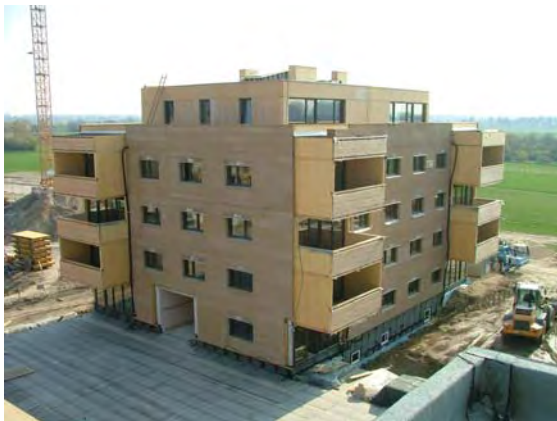
20.04.2006: Haus C