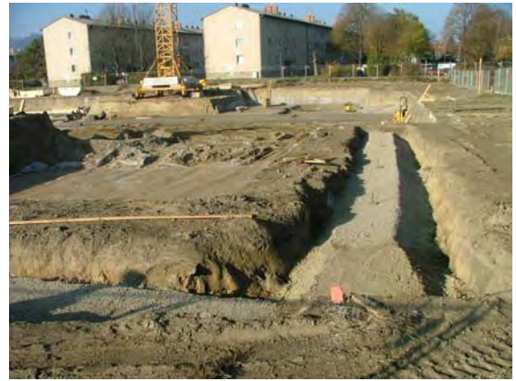
08.11.2005: Pfahlrost Haus D