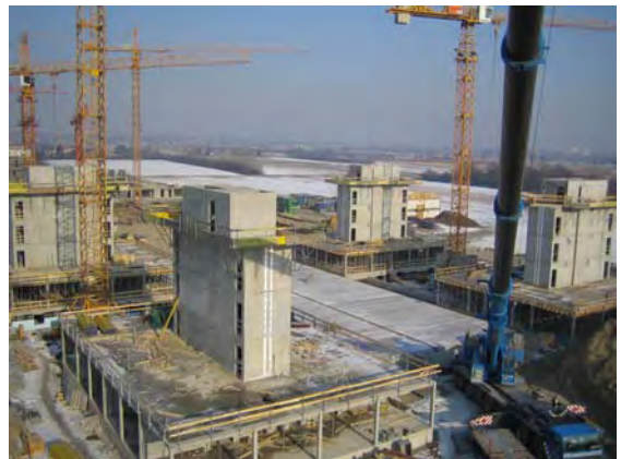
24.01.2006: Treppenhäuser mit gedeckter Tiefgarage