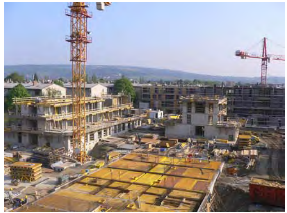
05.05.2006: Bauplatz B – Blick zum Bisamberg