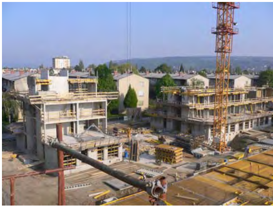
05.05.2006: Bauplatz B – Blick zum Bisamberg