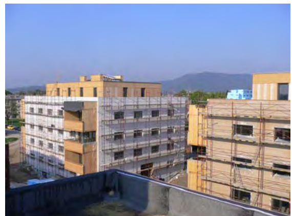
05.05.2006: Haus A, B – Blick zum Kahlenberg