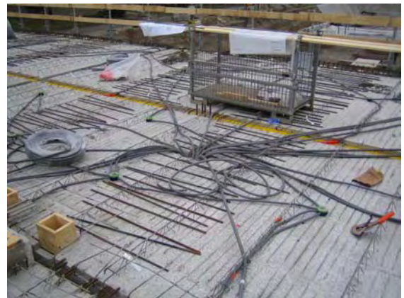
14.12.2005: Leerverrogrund Decke über UG