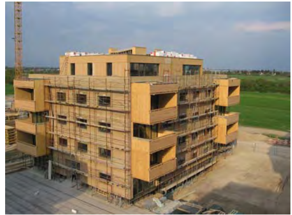
26.04.2006: Haus C eingerüstet