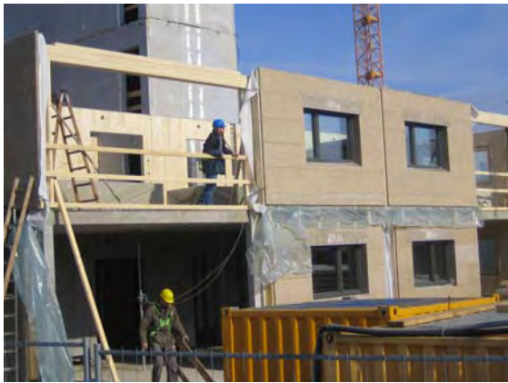
14.02.2006: Holzüberzug im Bereich der großen Verglasungen