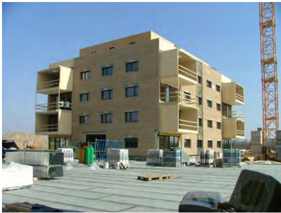
24.03.2006: Haus C, Montage Fertigteile abgeschlossen