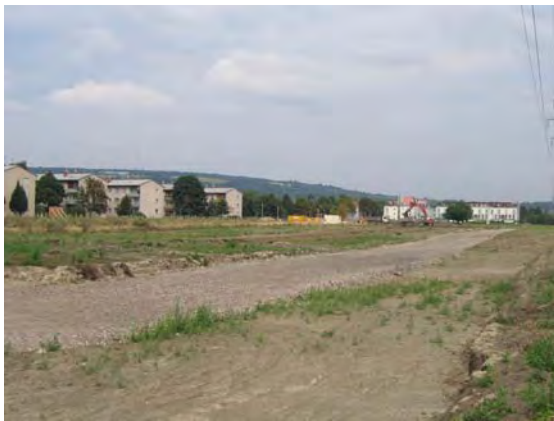
19.08.2005: Herstellen der Höhenlage der neuen Erschließungsstraße, Blick in Richtung Bisamberg