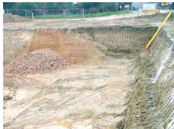
20.10.2005: Baugrubenaushub auf tragfähige Schicht, Bodenaustausch