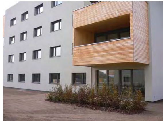
22.10.2006: Haus A – Terrasse, Loggia