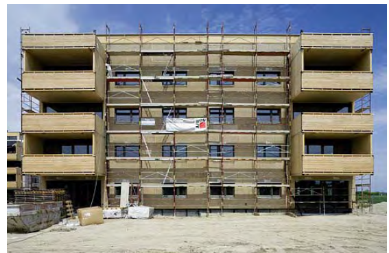
06.2006: Baustelle