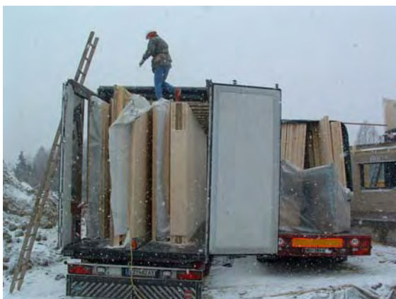
13.02.2006: Anlieferung in witterungsgeschützten Sondertransportern