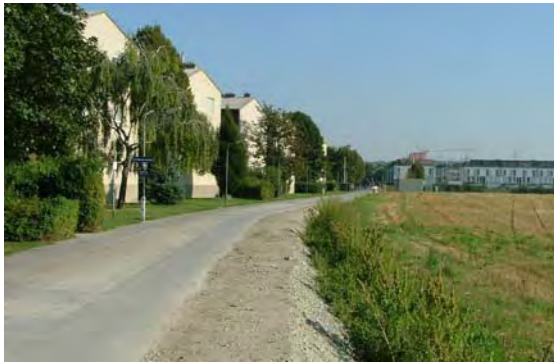
Mühlweg vor Baubeginn