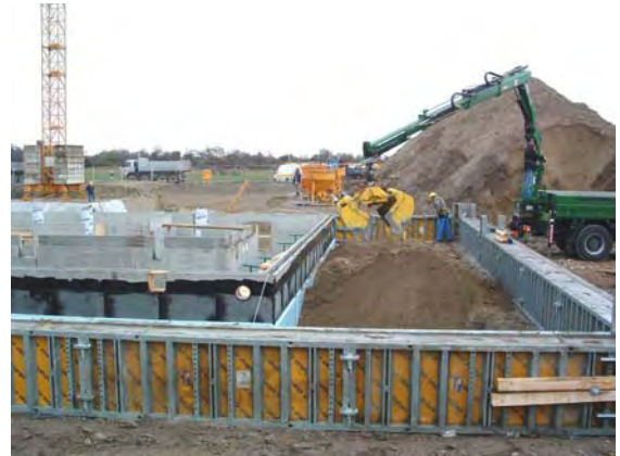
21.11.2005: Hinterfüllen zw. UG und Schürze der Pfahlroste Haus A