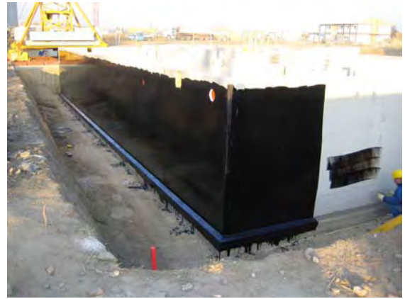
15.11.2005: Kellerwände Haus A, Voranstrich