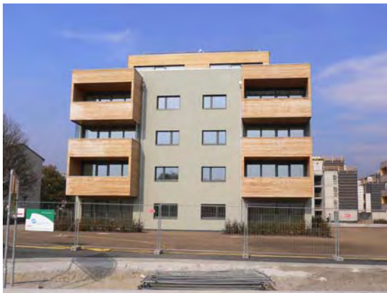
22.10.2006: Haus A – Südfassade