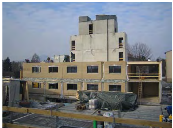
15.02.2006: Haus A