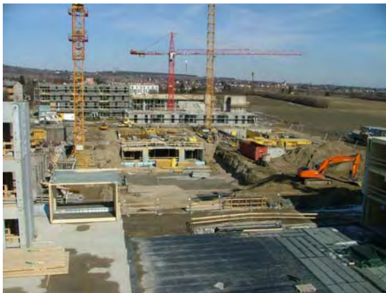
02.03.2006: Bauplatz B