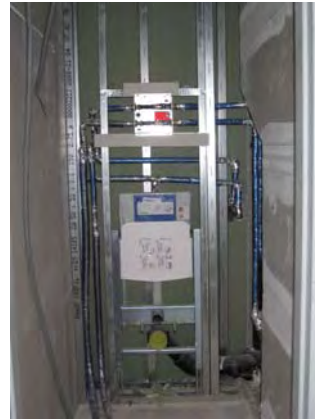
26.04.2006: WC- Einbauelement