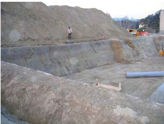
11.11.2005: Baugrube Haus D