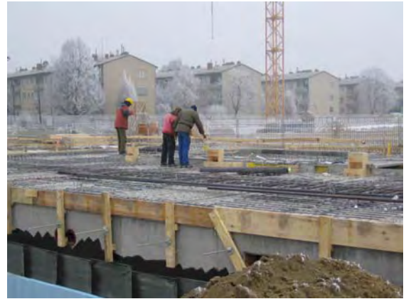
02.12.2005: Halbfertigteile Decke über UG, Haus D