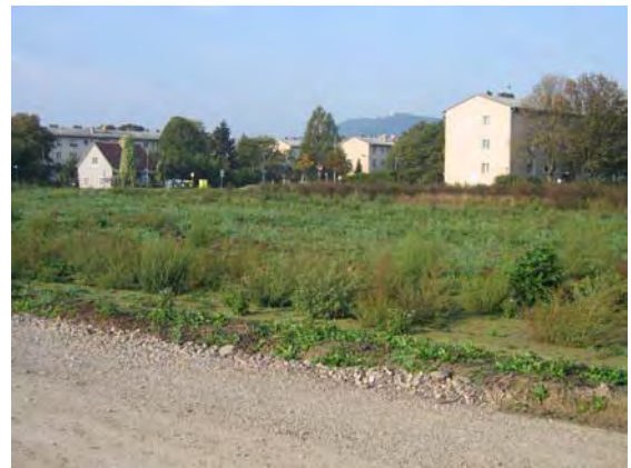
06.10.2005: Blick in Richtung Kahlenberg