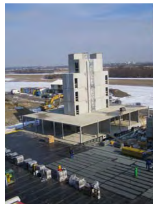
14.02.2006: Haus C bereit für die Montage