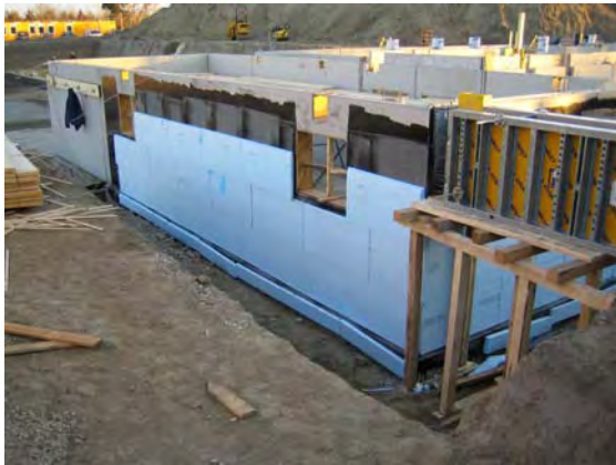
17.11.2005: Dichten und Dämmen UG Haus A