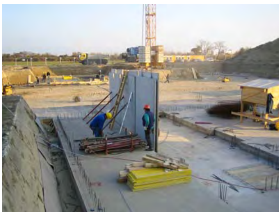
15.11.2005: Aufstellen der Treppenhausefertigteile Haus B