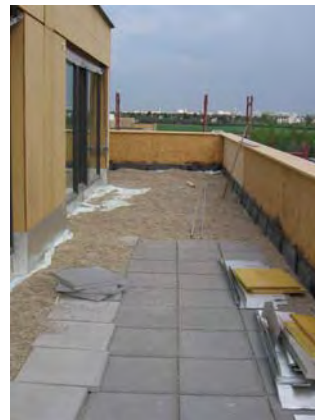
26.04.2006: DG Terrassenbelag in Arbeit