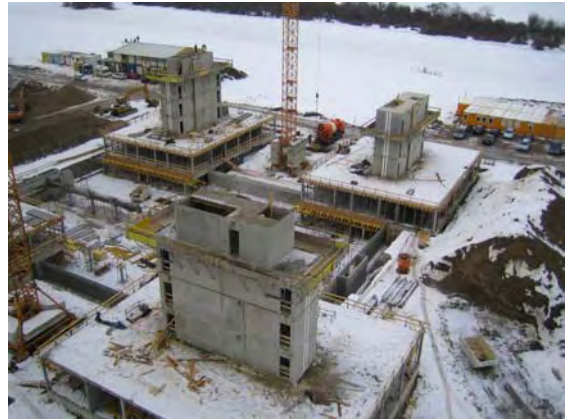
18.01.2006: Treppenhäuser Haus A, C und D