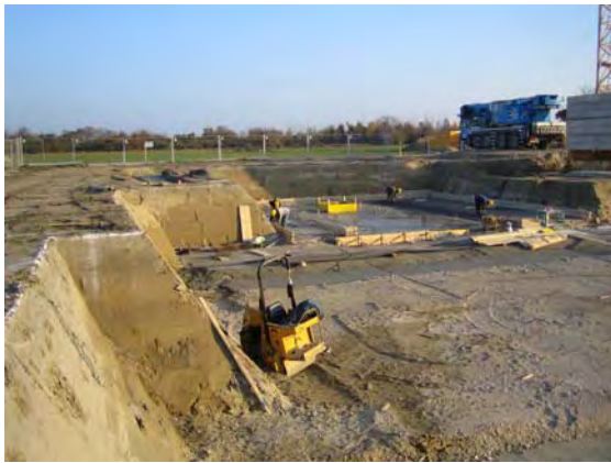
15.11.2005: Herstellen Niveau für Bodenplatte TG