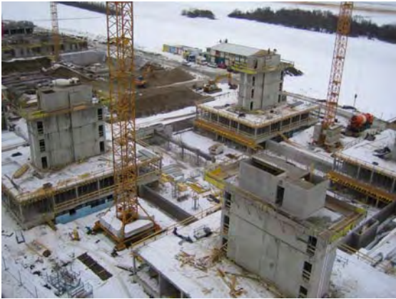
18.01.2006: Treppenhäuser Haus A, B und C