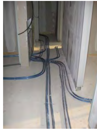
26.04.2006: Bodeninstallation (Heizung)