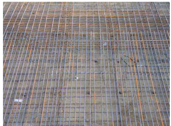
11.11.2005: Bewehrung Bodenplatte