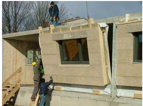
09.02.2006: Drücken in den Fußposition