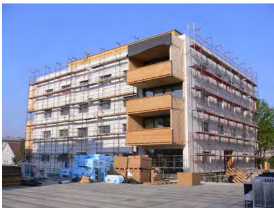
05.05.2006: Haus A eingerüstet, Verputzarbeiten