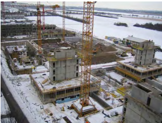
18.01.2006: Bauplätze A, B und (der eigene) C