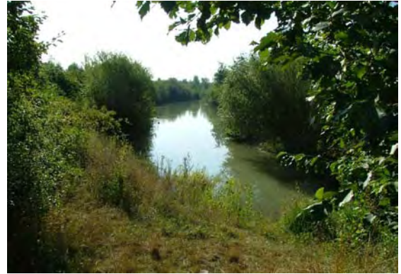
Der Marchfeldkanal in unmittelbarer Nähe