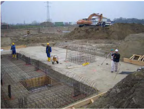
07.11.2005: Sauberkeitsschicht Haus A, bewehren der Bodenplatte Treppenhaus mit Aufzugsunterfahrt