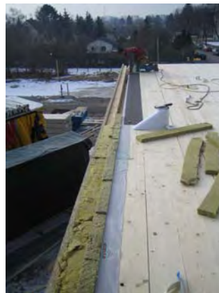
15.02.2006: Nachbearbeitung am Detail Fassade - Decke